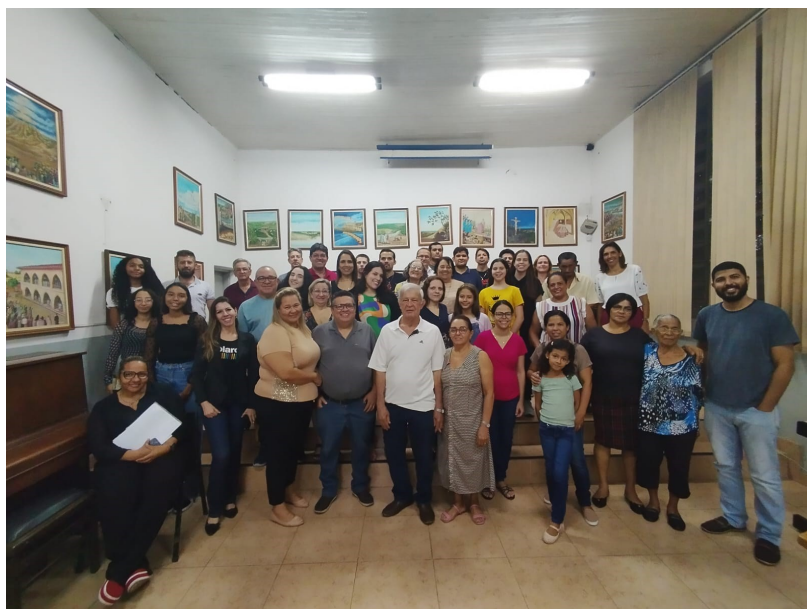
Grupos familiares reunidos na última quarta (31/01). Participe!